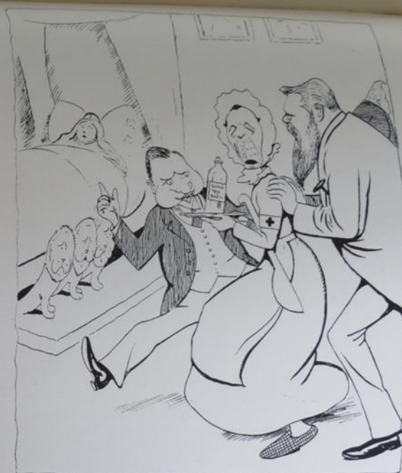
»Mutter Danmark skal have en ny Grundlov. II.« »To Tempi duer ikke, Madam Berntsen, task og gesvindt, hele Flasken paa een Gang. Færdig!« (»Klods Hans«, 30. Maj 1913.)

Som det fremgår af teksten, var der uenighed om, hvor store doser demokrati, befolkningen kunne klare!