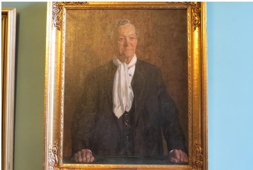
Portræt af Klaus Berntsen

Tanken om at stemmeret var en universal rettighed opstod først senere.